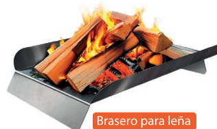
Brasero para leña