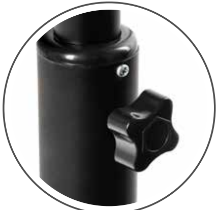
Ajuste de altura (1,45 m)