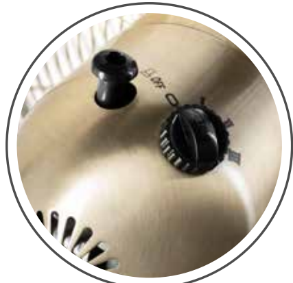
3 velocidades y perilla de oscilación