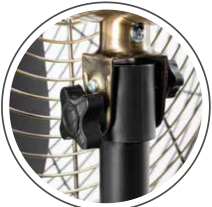
Ajuste de inclinación